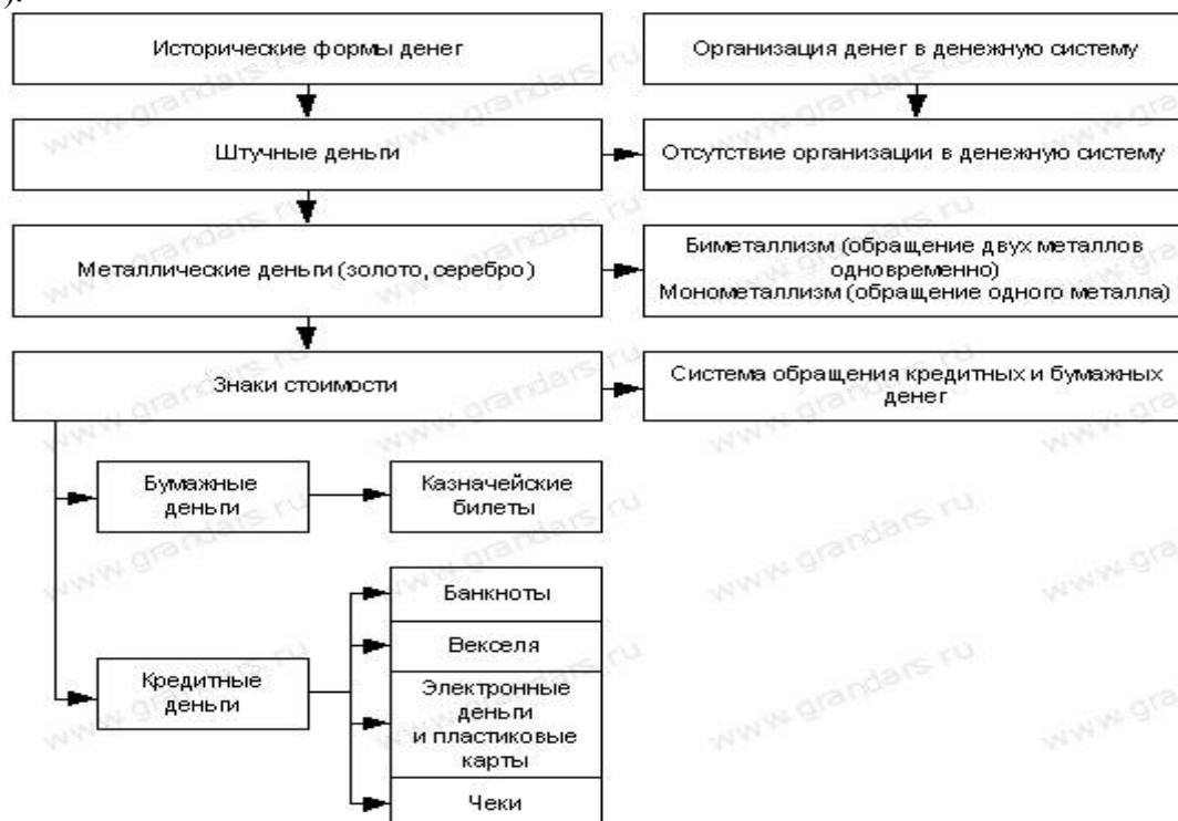
Рис. 1. Историческая эволюция формы денег и денежных систем

Эволюция денег от металлических до их представителей — законченных знаков стоимости, т. е. бумажных денег, привела к постепенной утрате золотом функций денежного товара и его возврату в мир других товаров. Демонетизация золота окончательно завершилась в 80-х гг. СС в., когда оно ушло из последней сферы товарно-денежных отношений, которую еще продолжало обслуживать, — мирового хозяйства. Бумажные деньги — не единственные знаки стоимости, которые обращаются в современных товарно-денежных отношениях. Другой законченный знак стоимости — кредитные деньги, выпускаемые в обращение коммерческими банками, а также специальными кредитно-финансовыми учреждениями, в процессе их кредитной деятельности (рис. 1).